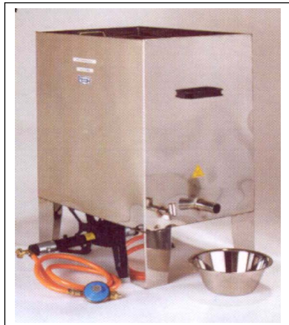
44030772 mit Propangasbrenner 11 kW